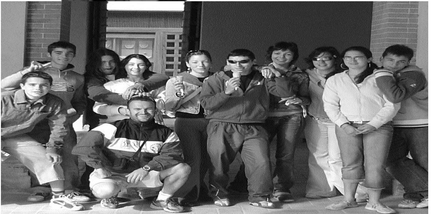
PASEANDO POLA MEZQUITA DE CORDOBA DESPOIS DO CAMPEONATO DE ESPAÑA DE MARATON